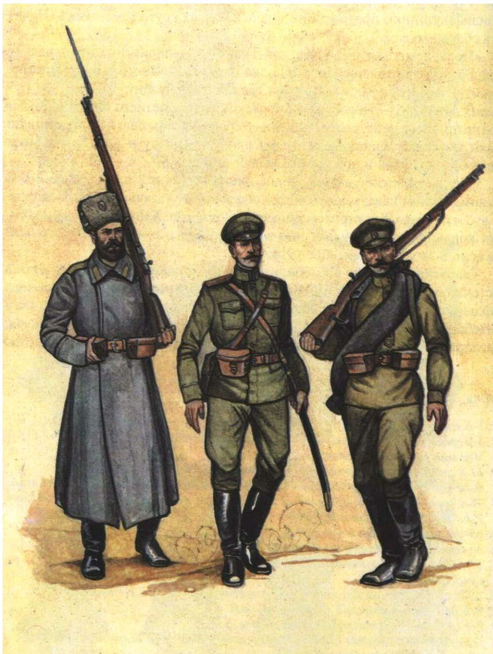
Образцы форм Первой Мировой войны