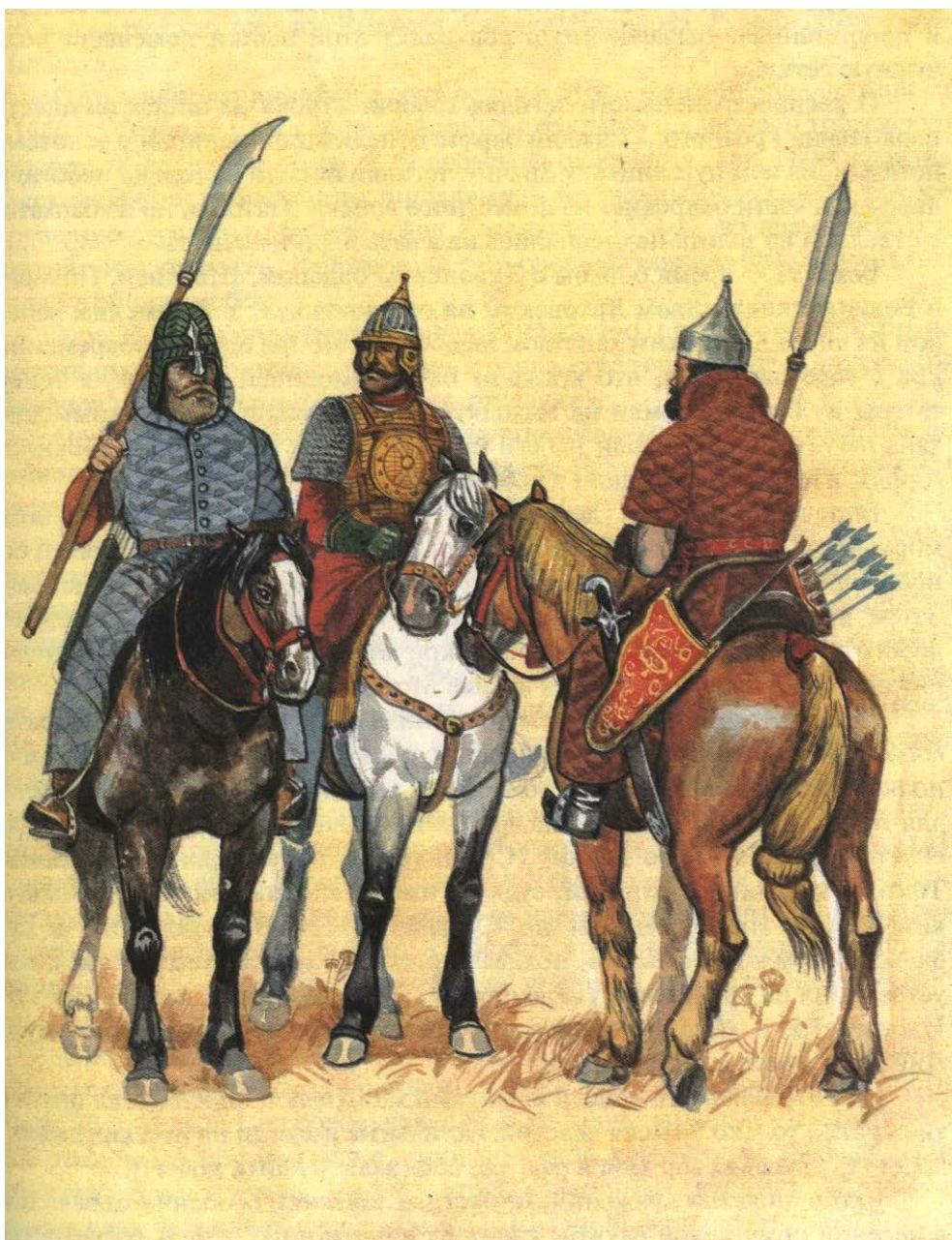
Дворянское ополчение XVI века