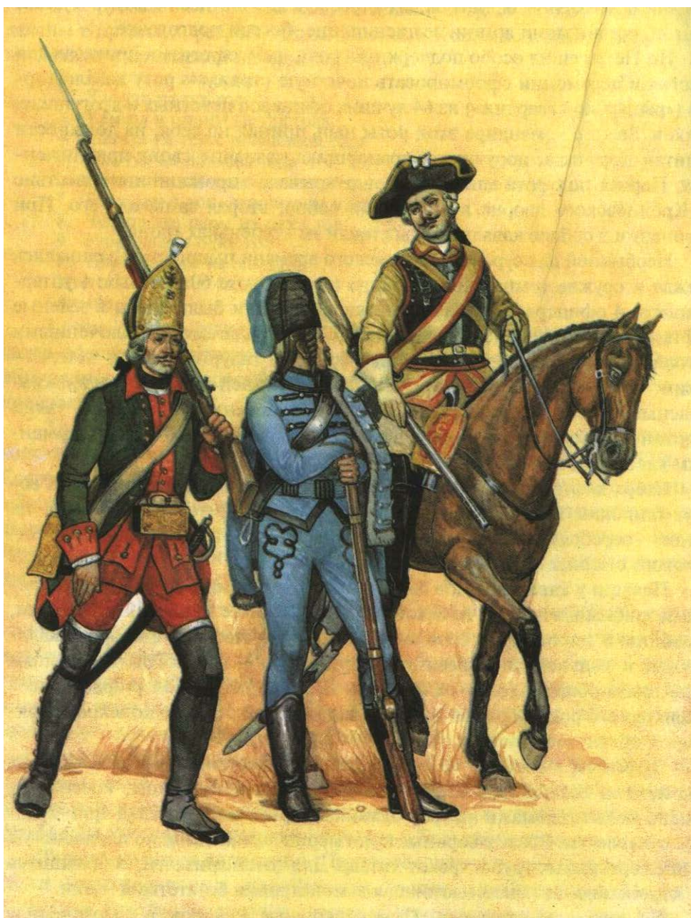
Гренадер, гусар и кирасир времён Елизаветы Петровны