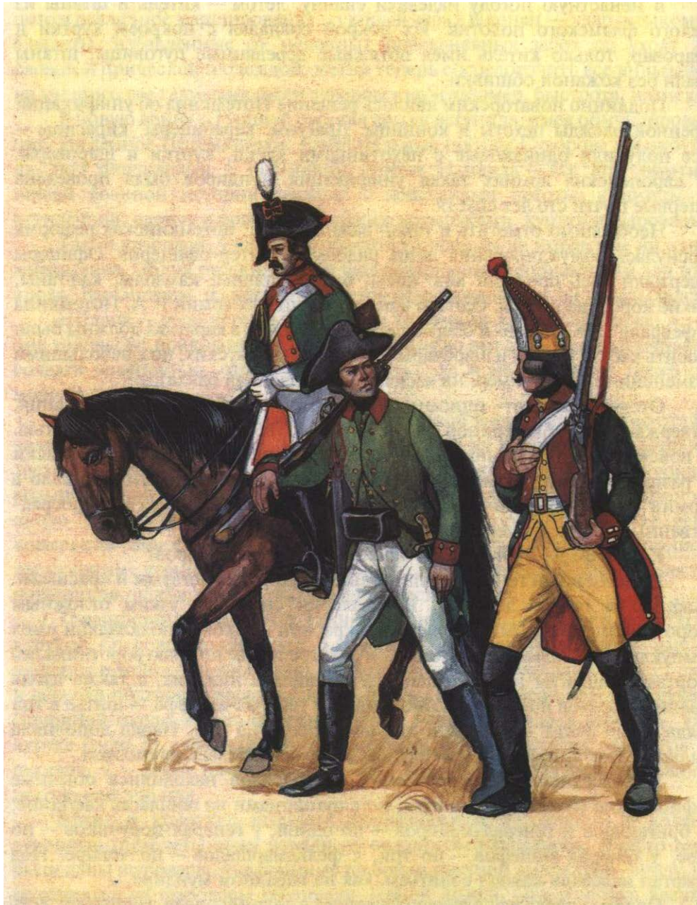
Кавалерист, пехотинец и гренадёр времён Павла I