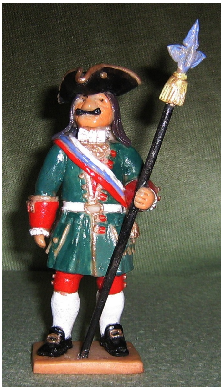
Обер-офицер лейб-гвардии Преображенского полка (униформа Петровской эпохи)