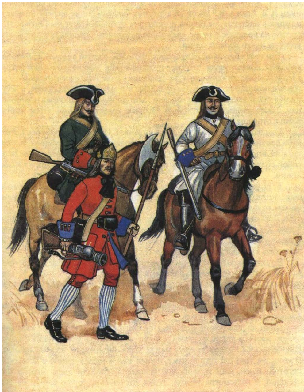
Драгуны и бомбардир времён Северной войны 1700-1721гг.