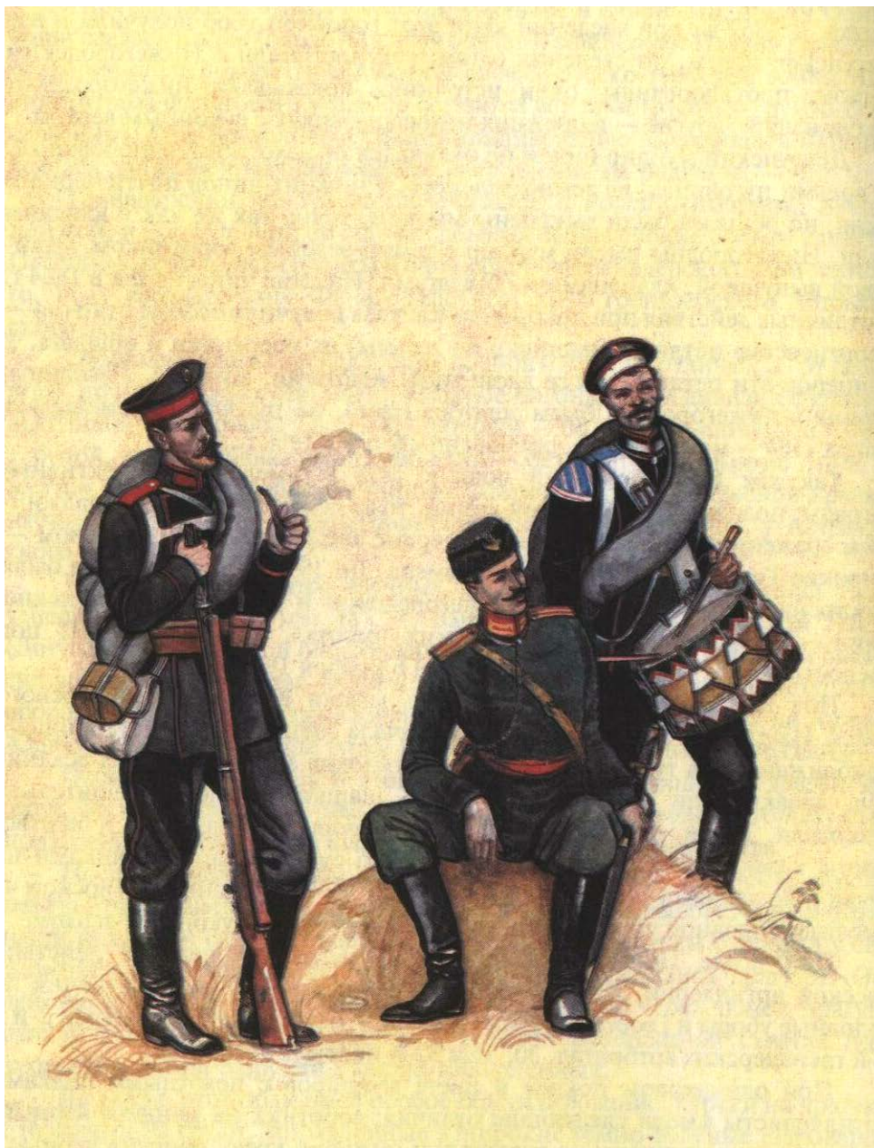
Офицер, пехотинец и барабанщик гвардейских полков времён Александра III