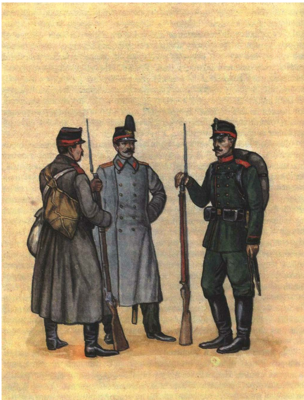
Офицер и рядовые в формах по реформе 1862 года