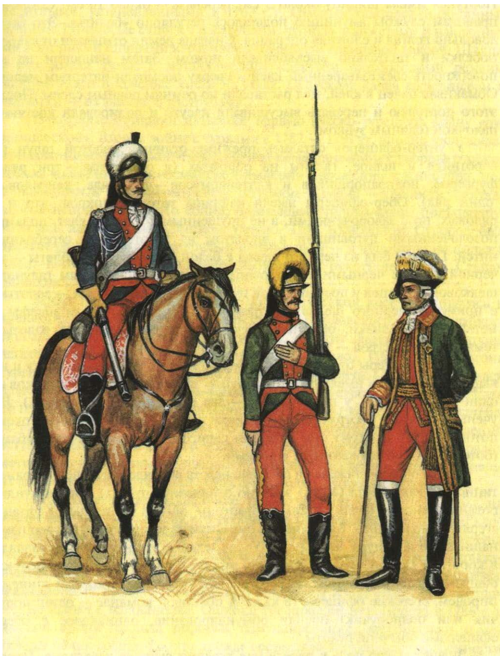
Кавалерист, пехотинец и штаб-офицер в формах Потёмкинской реформы 1886 года