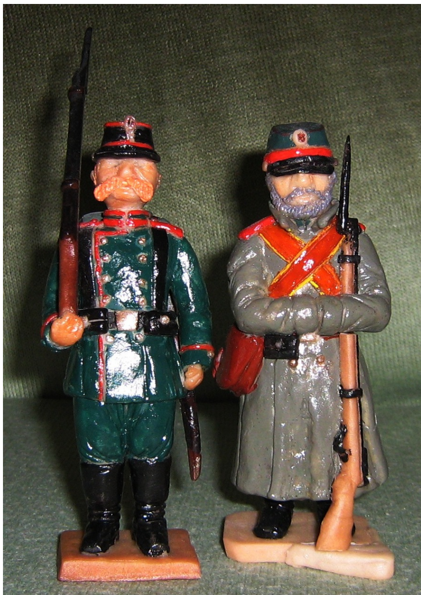
Рядовые пехотных полков (униформа 1862 года)