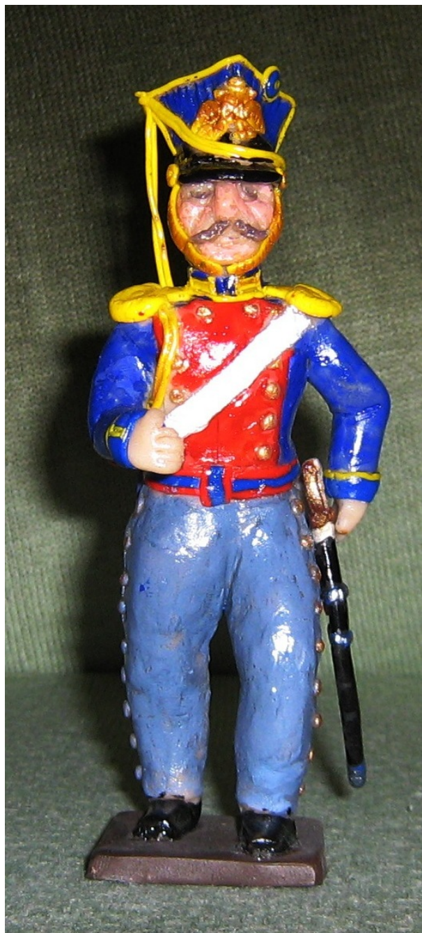
Рядовой лейб-гвардии уланского полка (форма 1812 года)