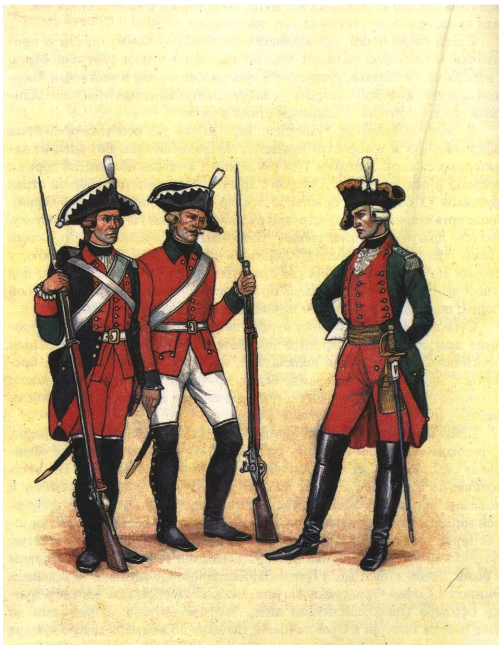
Офицер и рядовые Суздальского пехотного полка времён Екатерины II