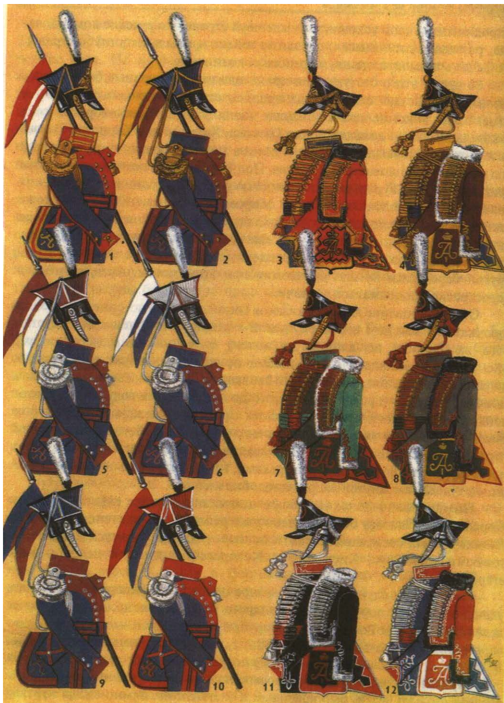
Образцы уланской и гусарской форм времени войны 1812 года