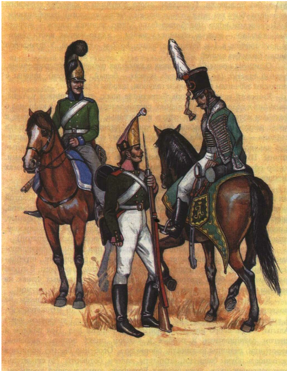
Драгун, гренадёр и рядовой Киевского гусарского полка в формах начала XIX века