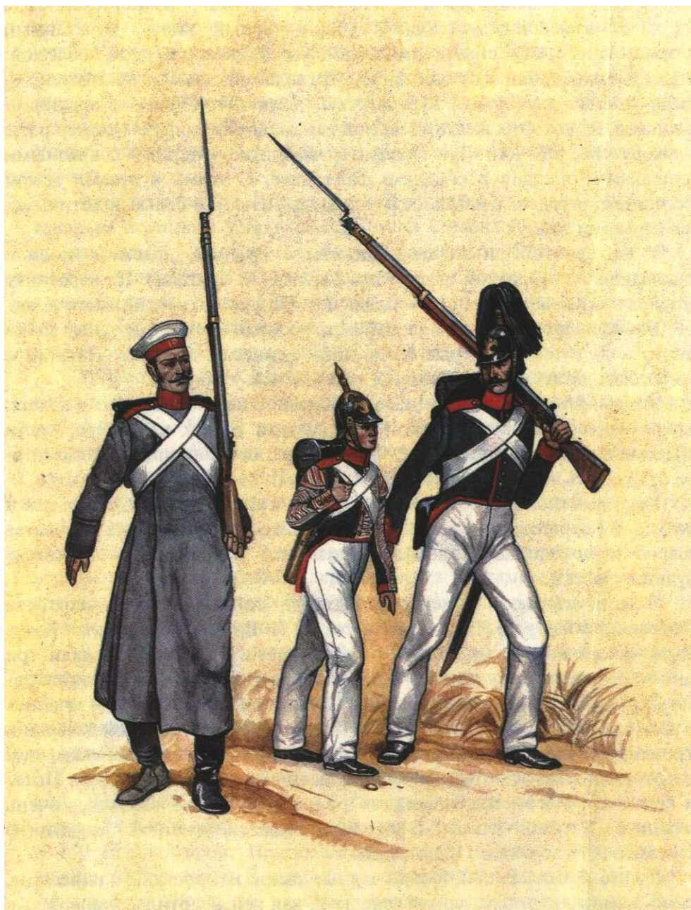
Рядовые в формах времён Николая I