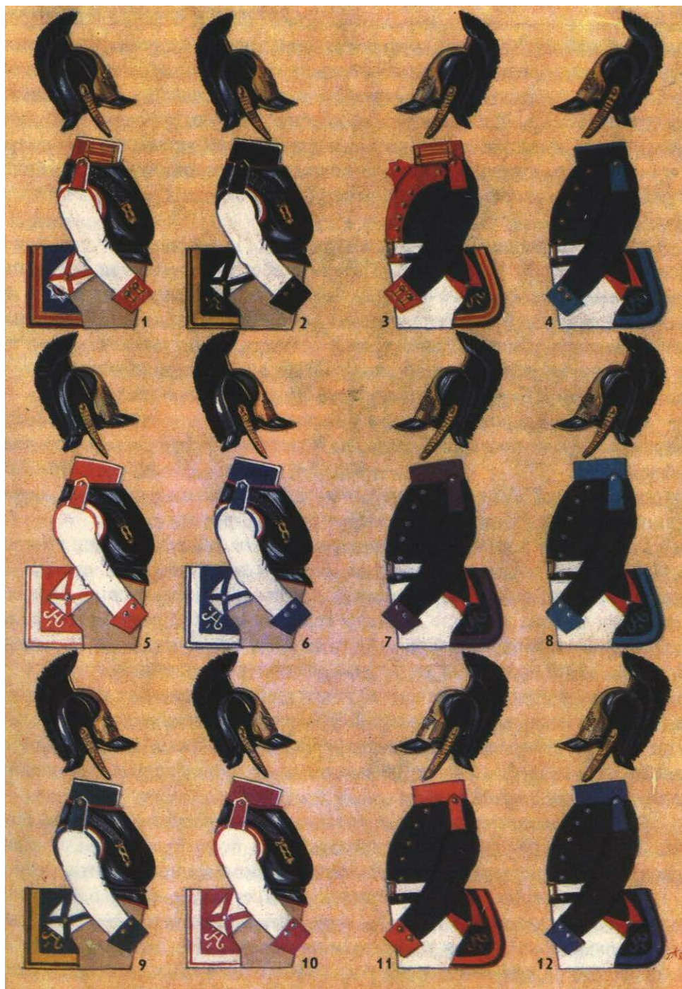
Образцы кирасирской и драгунской форм времени войны 1812 года