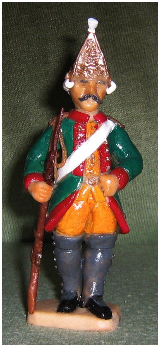
Рядовой Московского гренадёрского полка (форма 1796 года)