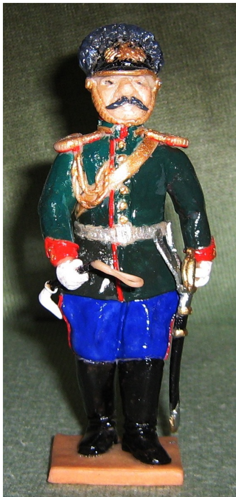
Обер-офицер лейб-гвардии драгунского полка (униформа 1907 года)