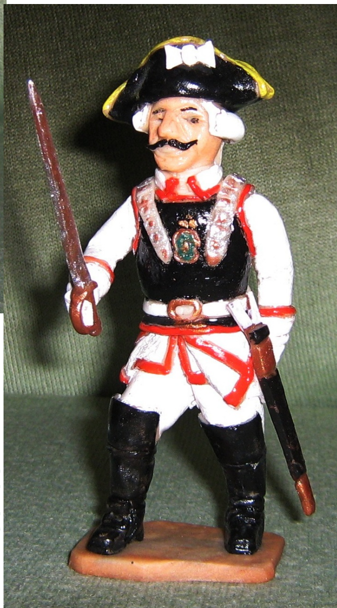
Обер-офицер кирасирских частей (униформа эпохи Елизаветы Петровны)